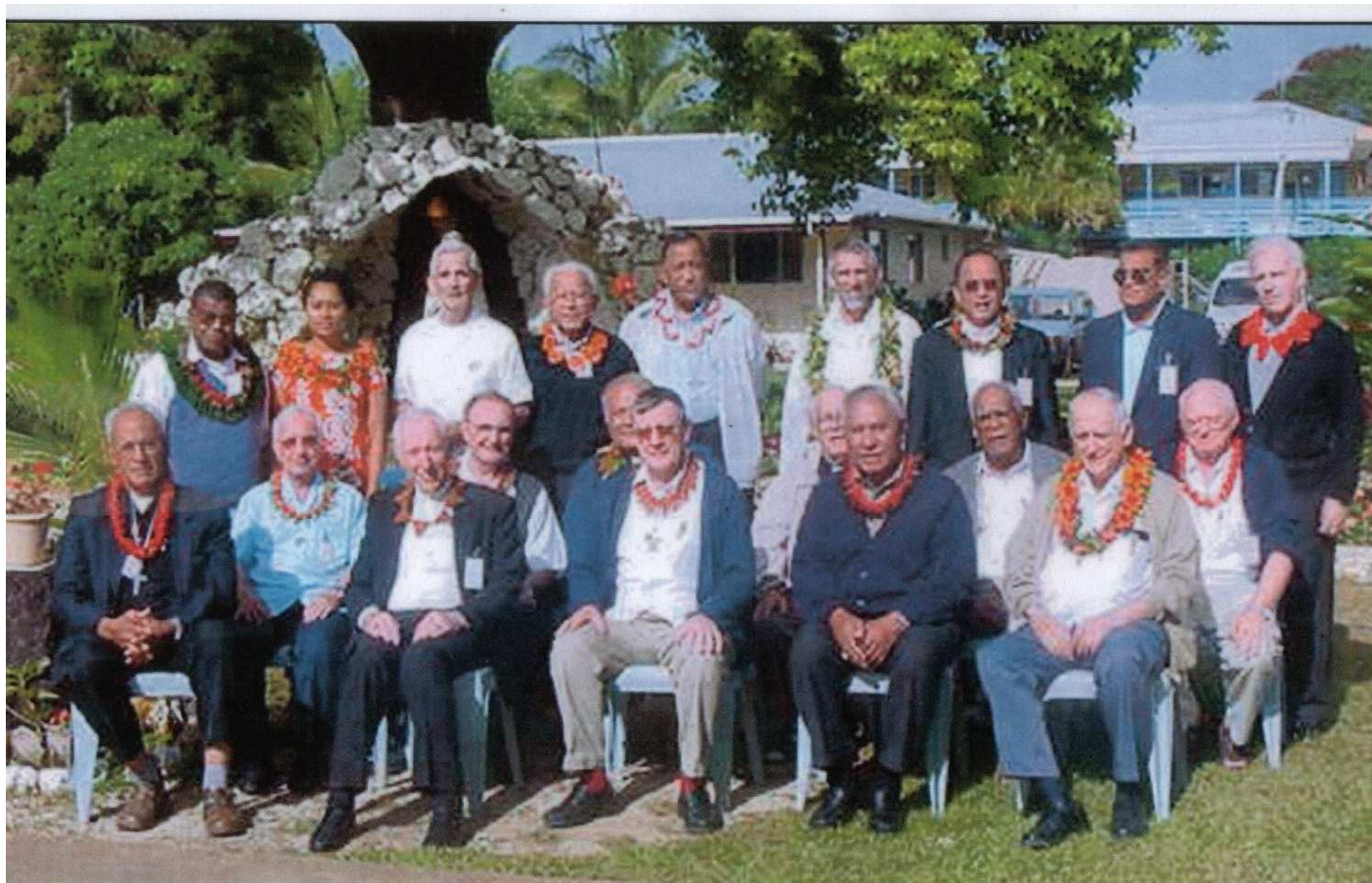
CONFERENCE DES EVEQUES DU PACIFIQUE (CEPAC) NUKU'ALOFA, TONGA. (28TH - 31ST JULY, 2003) EPISCOPAL CONFERENCE OF THE SOUTH PACIFIC (CEPAC) NUKU'ALOFA, TONGA. (28TH - 31ST JULY, 2003)